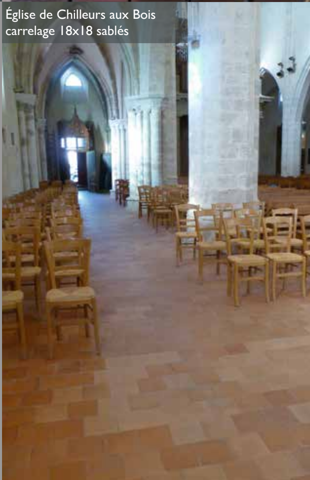
Église de Chilleurs aux Bois carrelage 18x18 sablés