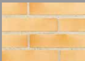
Plaquette 5.5 ton Paille