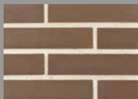
Plaquette 5.5 ton Brun